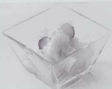
↑商品番号(37) 大山産うり浅漬 453円

この夏の新商品は、当地鶴岡市大山地区の特産である「白うり」を使った浅漬です。本長では、地元の契約農家さんから栽培してもらっています。このうりは、粕漬用にすぐに塩蔵されますが、入荷してすぐの生の新鮮なうりをスライスして浅漬にしたのがこちらの商品です。色もひんやり色と見て目と夏らしい一品です。薬膳では、うり科のものは、身体を冷やす作用、潤滑作用があり、夏にふさわしい食べ物と言われている。